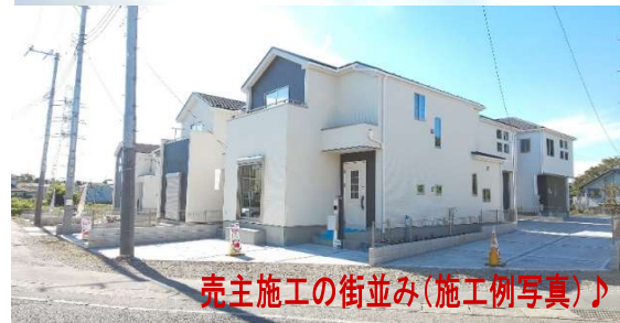
売主施工の街並み(施工例写真)♪

※建築条件付き売地とは、土地売買契約後3ヶ月以内に本物件土地売主と住宅建築請負契約を結んで頂くことを停止条件として販売します。指定された期限までに建物建築請負契約が成立しなかった場合は、土地の売買契約がはじめからなかったものとして、手付金、預かり金その他名目を問わず、支払い済みの金銭は無条件で全額返還されます。